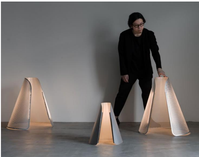
Das durch die Haori-Form gedämpfte Licht vermittelt ein Gefühl von Komfort und Ruhe – ein Empfinden, das auch der Designer beim Tragen seines ersten Haori erlebte.

Ein harmonisches Zusammenspiel von Emotionen und innovativem Design spiegelt sich im Gestaltungskonzept des japanischen Designers Atsushi Shindo wider: Inspiriert von dem Gefühl der Leichtigkeit und Zufriedenheit beim Tragen eines traditionellen japanischen Haori-Kimonos, entwickelt der Designer ein Produkt, das die elegante Form und das Gefühl von Komfort in die Welt der Innenarchitektur überträgt. Das Ergebnis seiner kreativen Reflexion trägt ebenfalls den Namen „Haori“ – ein Lichtobjekt, das durch eine minimalistische und individuell anpassbare Formgebung überzeugt.