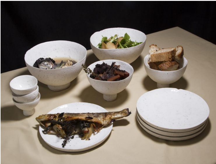
Ekel oder Genuss? Nicholas Plunketts Geschirrsset stellt provokativ den Ressourcenumgang der Gesellschaft in Frage. Foto: Nicholas Plunkett.