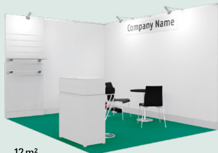
12 m 2