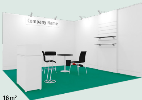
16 m 2