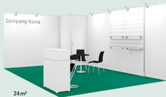
24 m 2